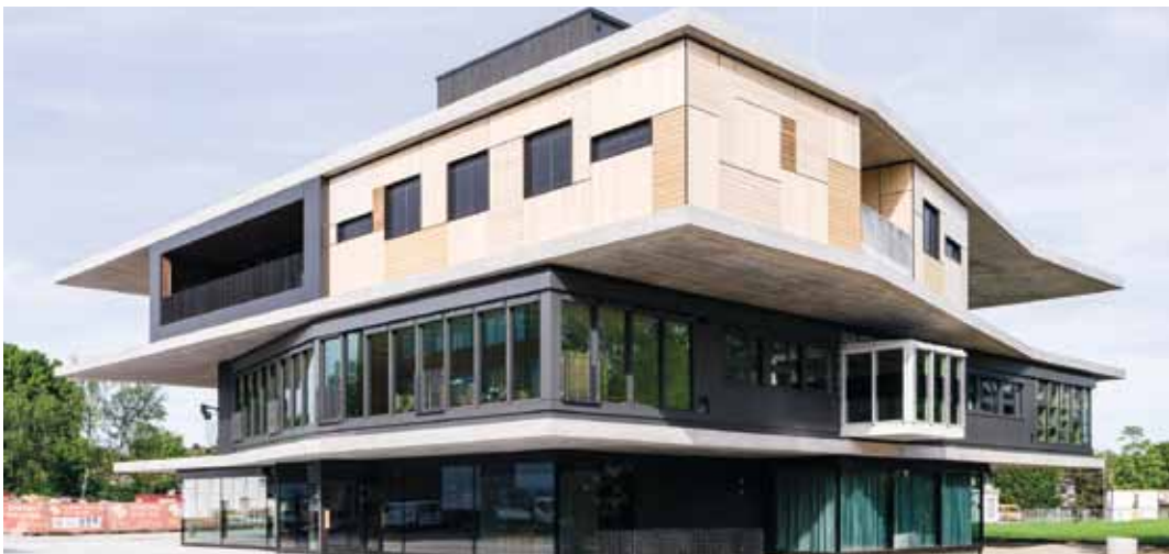
Forschungsgebäude NEST der Empa in Dübendorf mit Modulen aus Fagus-Brettspertholz.

Bis zum Redaktionsschluss dieses Berichts fehlte noch die Zusage der Beiträge von Bund und Kantonen im Rahmen der neuen Regionalpolitik (NRP). Von der NRP wird der Grossteil der Fremdmittel in Form von langfristigen Darlehen erwartet. Die verbindliche Zusicherung ist