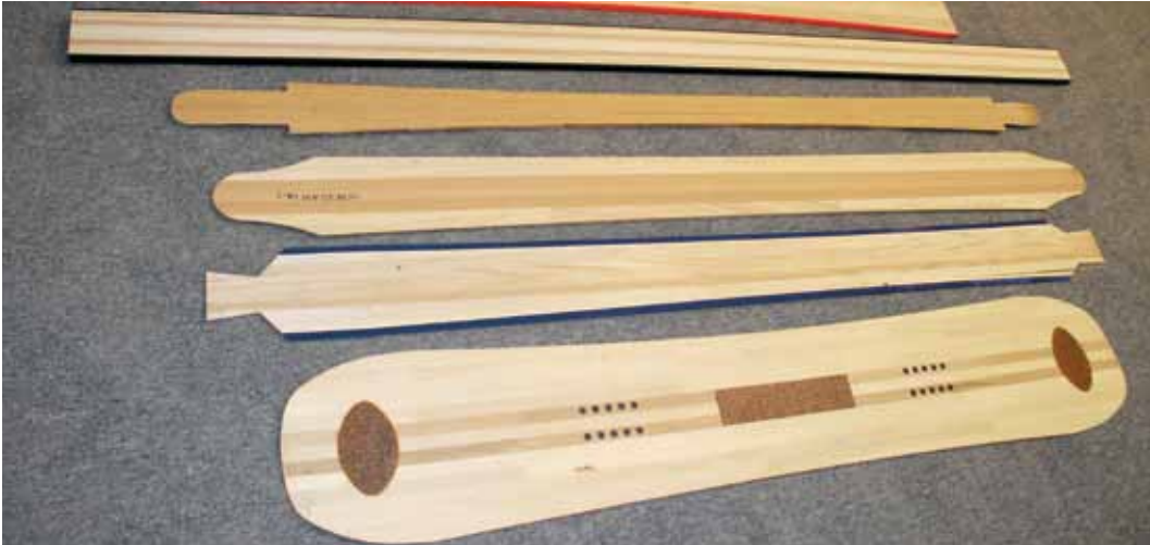
Weltweit führend: Die von der Firma Hess produzierten Holzkerne für Ski und Snowboards.

Zugsböden und Prallwände für Turnhallen produziert. Dazu wurden die Sperrhölzer bezüglich statischer Werte getestet und bilden nun eine zugelassene Rechenbasis für Ingenieure im Holzbau. In bedeutenden Holzbauten in der Schweiz wurde bei statisch anspruchsvollen Problemlösungen auf das Sperrholz der Firma Hess zurückgegriffen. Zu nennen ist das neue Tamediagebäude in Zürich und das sich im Bau befindende neue Swatch-Gebäude in Biel.