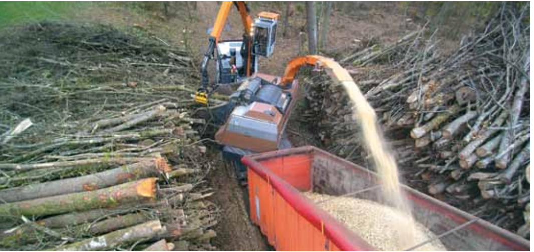
Verarbeitung zu Energieholz.

in den Fokus der Öffentlichkeit rückt, erwartet die Raurica Holzvermarktung AG im inländischen Markt eine rege Nachfrage nach Schweizer Holz.